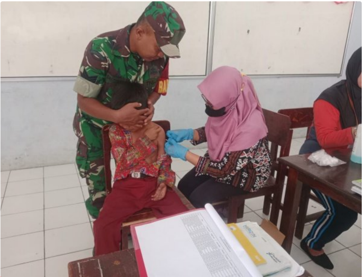
Peduli Kesehatan Generasi Muda, Babinsa Koramil 13 Bendo Dampingi Kegiatan BIAS

Magetan. – Bulan Imunisasi Anak Sekolah (BIAS) adalah bulan dimana seluruh kegiatan imunisasi dilaksanakan di seluruh Indonesia, oleh Menteri Pendidikan dan Kebudayaan, Menteri Dalam Negeri, Menteri Agama serta Menteri Kesehatan, yang bertujuan untuk mencegah serta mempertahankan kekebalan dalam tubuh, pengendalian penyakit campak dalam jangka panjang melalui imunisasi Campak