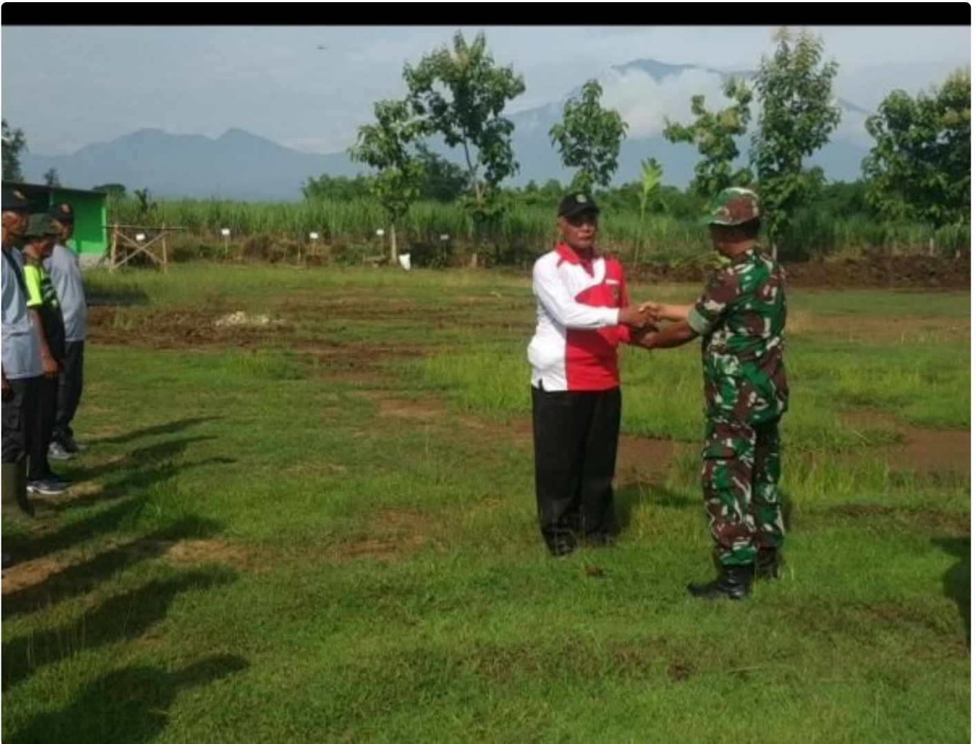
Jaga Kelestarian Alam Kodim 0804/Magetan Tanam 1.950 Bibit Pohon Sukun

Magetan – Sebagai bagian dari upaya menjaga kelestarian lingkungan dan mendukung program penghijauan yang dicanangkan pemerintah, TNI dari Kodim 0804/Magetan bersama pemerintah desa, masyarakat dan pengiat lingkungan menggelar kegiatan penanaman bibit sukun di seluruh wilayah Koramil jajaran Kodim 0804/Magetan secara serentak yang dilaksanakan tanggal 6-9 Januari