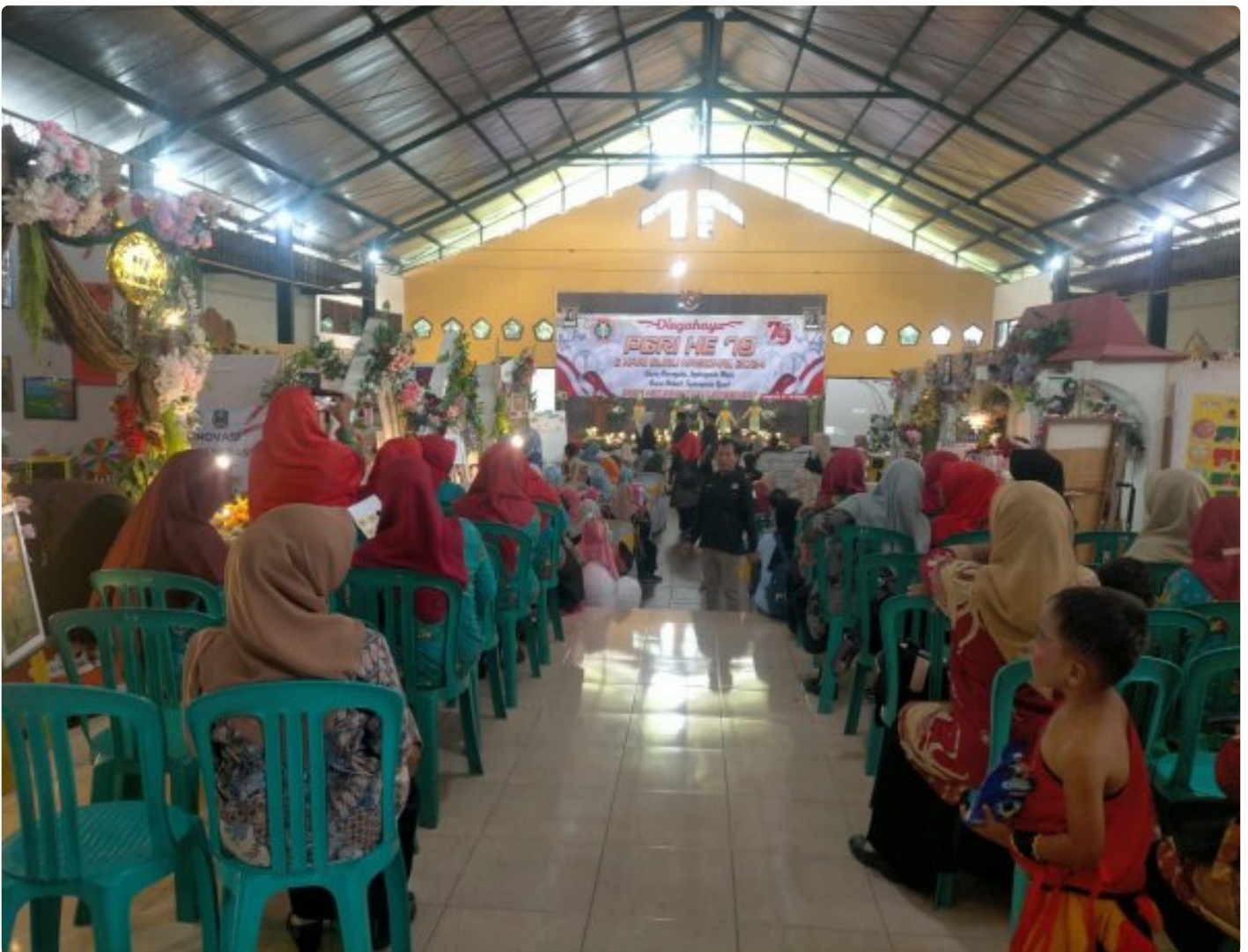
Danramil 0804/12 Lembeyan Hadiri HUT PGRI Ke-79 Dan Hari Guru Nasional (HGN) Se Kecamatan Lembeyan Tahun 2024