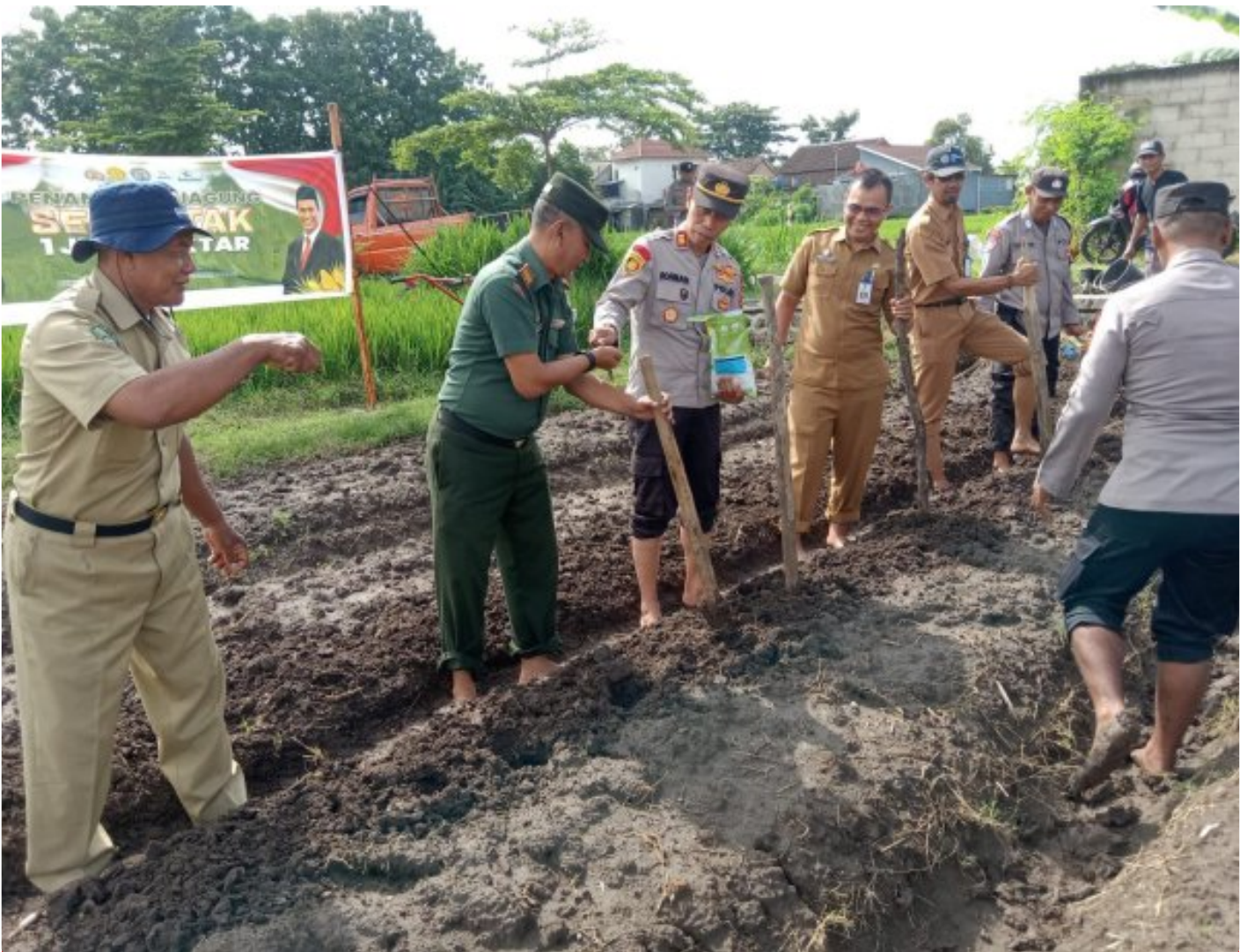
Bersinergi Danramil 0804/11 Takeran Bersama Kapolsek Dalam Kegiatan Penanaman Jagung

Magetan. Forkopimca bersama Anggota dan Dinas Pertanian melakukan penanaman benih jagung dilahan aset Polres Magetan. Bertempat di Dukuh Takeran RT 04 Rw 01, Kelurahan Takeran, Kecamatan Takeran, Kabupaten