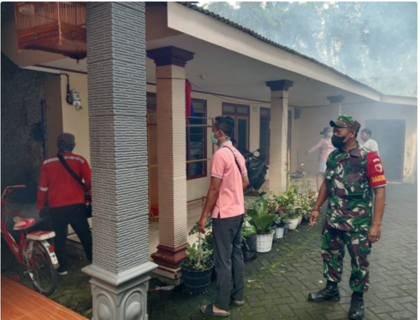
Babinsa Bersama Dinkes Dampingi Fogging, Cegah DBD di Wilayah Desa Binaan