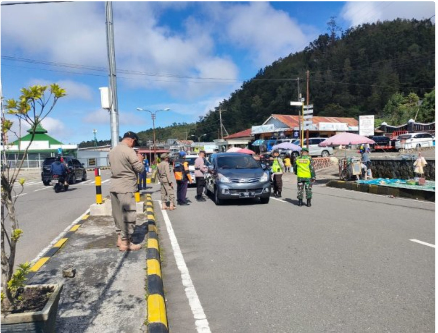
Anggota Koramil 0804/02 Plaosan Ikut Menjaga Pos Pengamanan Nataru di Wilayah Binaan

Magetan. - Anggota Koramil 0804/02 Plaosan bersama Anggota Polsek, Pol PP, Dishub, Puskesmas, dan senkom memantau keamanan dan kondusifitas di tempat wisata, perbatasan di wilayah kecamatan Plaosan dalam rangka Natal